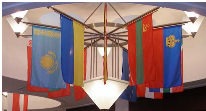
Рис. 4 Флаги стран-участниц конференции «COINS 2008»

Конкурсные монеты оценивало жюри, в состав которого вошли представители Государственного Эрмитажа (Россия), Государственного Исторического музея России, Британского музея (Великобритания), Венского музея истории и искусства (Австрия), Национального музея искусств имени Чюрлёниса (Литва), Даугавпилсского краеведческого и художественного музея (Латвия), коммерческих банков (Сбербанк России, Номос банка, Ханты-мансийского банка), российских и зарубежных периодических изданий, а также нумизматы.