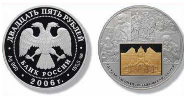
Рис. 3. Монета «150-летие основания Государственной Третьяковской галереи»

Приз «За вклад в развитие рынка монет из драгоценных металлов» получил Сбербанк России.