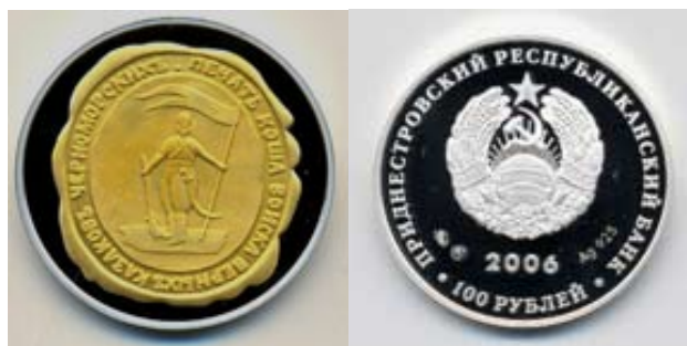
Рис.2. «Печать Коша»

Памятные монеты изготавливаются качеством чеканки «пруф» и «пруф-лайк», которые считаются одними из наилучших в мире и позволяют создавать из монет настоящие художественные произведения.