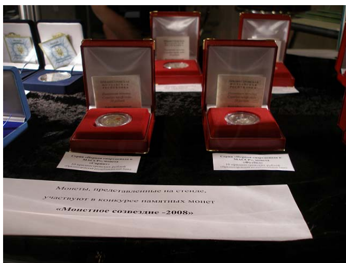
Рис. 5 Монеты Приднестровского республиканского банка, размещённые в рамках выставки конкурса «Монетное созвездие 2008»