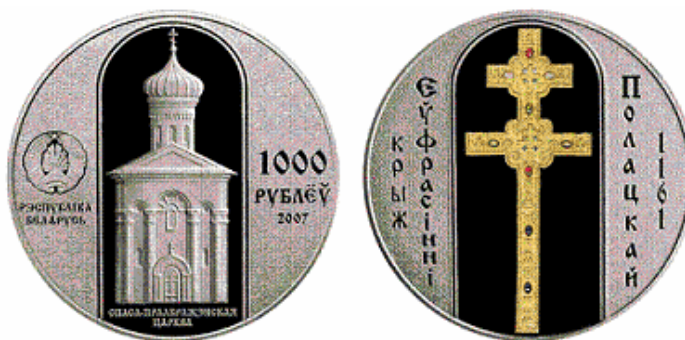
Рис. 6. Монета «Крест Евфросинии Полоцкой»

В номинации «Монета года» победила монета «Крест Евфросинии Полоцкой» (рис. 6), номиналом 100 белорусских рублей, выпущенная в обращение Национальным банком Республики Беларусь. Она отчеканена из серебра 925-й пробы (с покрытием золотом 999-й пробы и вставкой 17 искусственных камней) на Московском монетном дворе – филиале ФГУП «Гознак» (Россия). Масса монеты с камнями – 1 083,8 грамма; диаметр – 100 мм; тираж – 2 000 штук.