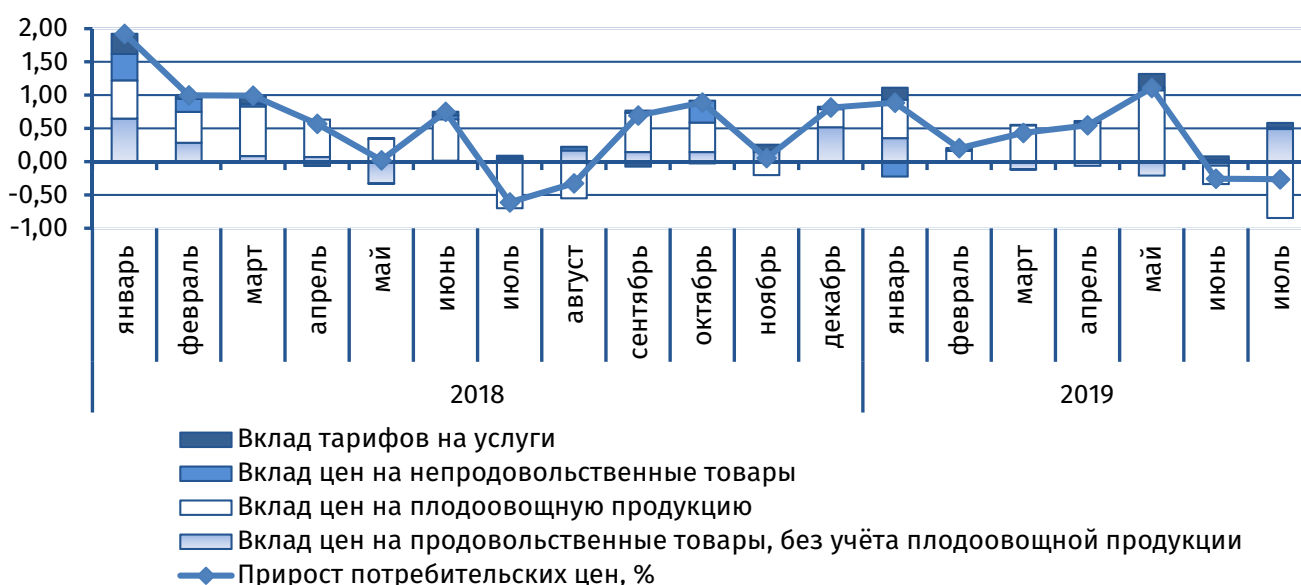
Рис.1. Вклад основных компонент в сводный индекс потребительских цен, п.п.

Понижительные корректировки цен, характерные для данного периода в связи с ростом предложения, зафиксированы на плодоовощную продукцию (-11,5%), вклад которой в совокупный индекс цен стал основополагающим (рис. 1). В разрезе структурных компонентов удешевлением затронуло картофель (-19,6%) и овощи (-21,4%). Снижение цен по данным позициям наблюдалось и на рынках стран – торговых партнёров: картофель – -6,7% в России, -8,2% в Беларуси, -31,5% в Молдове; овощи – -0,2% в Беларуси, -9,2% в России, -11,3% в Молдове, -13,6% в Украине. Фрукты, напротив, подорожали на 2,7%, что также соответствовало тенденциям, наблюдаемым на рынках большинства рассматриваемых стран: +0,2% в России, +1,0% в Украине, +3,8% в Молдове.