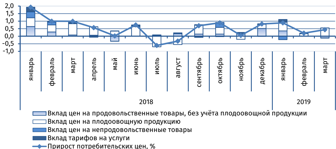
Рис.1. Вклад основных компонент в сводный индекс потребительских цен, п.п.

В марте стоимость стандартного набора товаров и услуг возросла на 0,4% (+1,0% в марте 2018 года). Проинфляционное влияние главным образом определялось ценовыми корректировками в продовольственном сегменте: индекс по группе составил 101,1%. Аналогичная тенденция отмечалась и годом ранее, однако удорожание продовольственных товаров было выше (+2,0%). В наибольшей степени, ввиду сезонного влияния, подорожала плодоовощная продукция – +7,4%, её вклад в совокупный прирост цен традиционно является определяющим (рис. 1). Стоимость овощей, входящих в обследуемую корзину, по итогам марта в среднем выросла на 13,4%, фруктов – на 3,8%. На рынках стран-партнёров также наблюдалось повышение цен на овощи (+1,4% в Беларуси, +2,4% в Украине, +4,6% в России, +5,6% в Молдове) и фрукты (+0,3% в России, +0,7% в Беларуси, +1,6% в Молдове, +1,7% в Украине). Стоимость картофеля, напротив, снизилась на 0,4%, в то время как на рынках рассматриваемых стран фиксировалась разнонаправленная динамика: в России и Молдове – рост на 1,2% и 7,1% соответственно, в Беларуси её уровень остался неизменным.