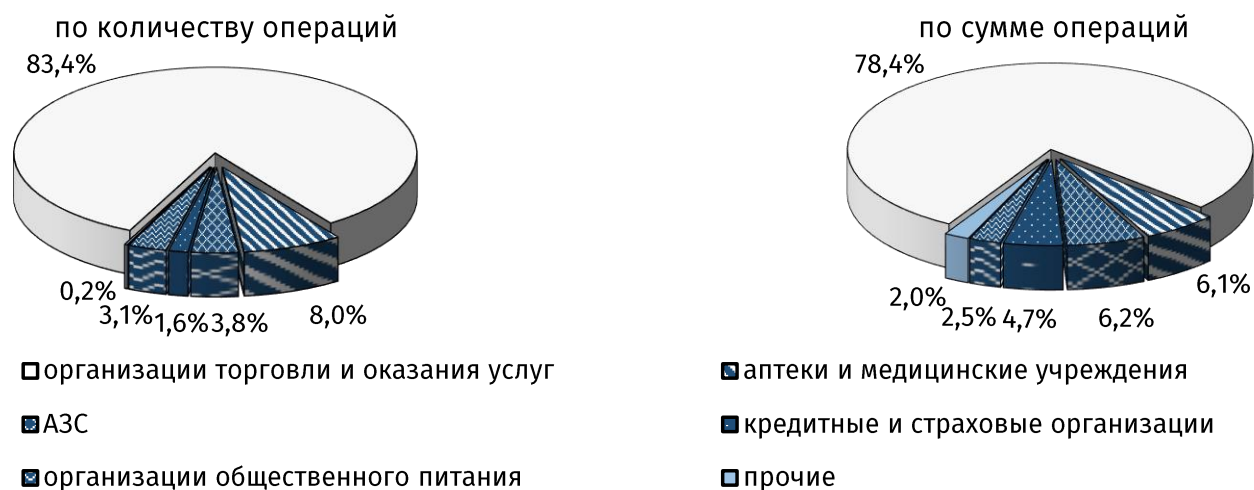
Рис. 2. Структура безналичных операций в пунктах размещения платёжного оборудования в июле 2021 года, %

сумма – на 1,7%, до 632,7 млн руб. (+22,5% соответственно). Число операций, осуществлённых посредством банкоматов и платёжных терминалов, сократилось на 1,2%, до 423,7 тыс. ед. (-18,5% к аналогичному месяцу 2020 года), в денежном выражении – на 1,7%, до 268,5 млн руб. (-16,8% соответственно). Через электронные торговые платформы (E-commerce) 1 было проведено 287,0 тыс. операций (+3,5% к предыдущему месяцу) на общую сумму 65,1 млн руб. (+4,3% соответственно).