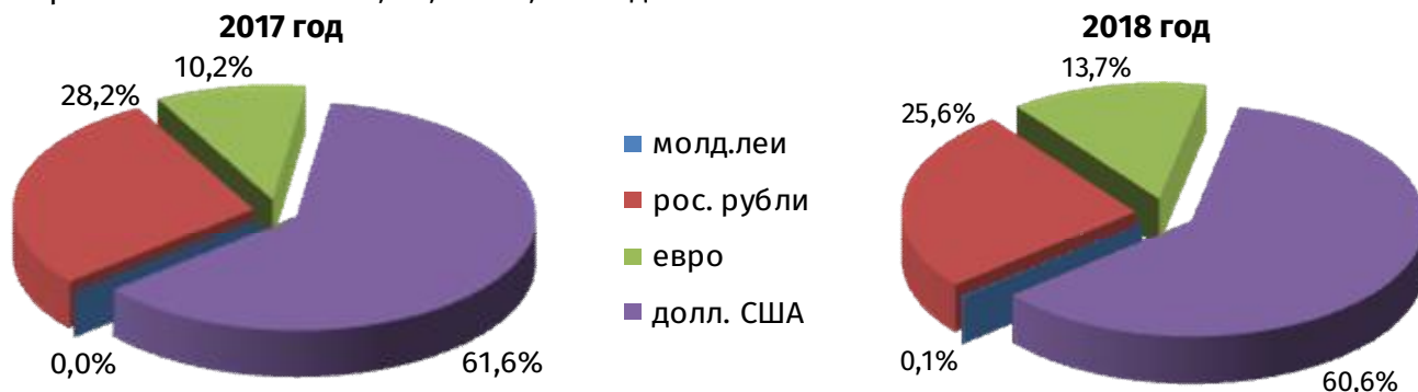
Рис. 2. Валютная структура поступивших денежных переводов в I полугодии 2017–2018 гг.

значению сопоставимого периода 2017 года, когда аналогичные ремитенции составили 13,9 млн долл. В страны СНГ из республики было перечислено 83,5% всех трансфертов, или 11,5 млн долл., в дальнее зарубежье – 16,5%, или 2,3 млн долл., в том числе в страны Европейского союза – 4,5%, или 0,6 млн долл.