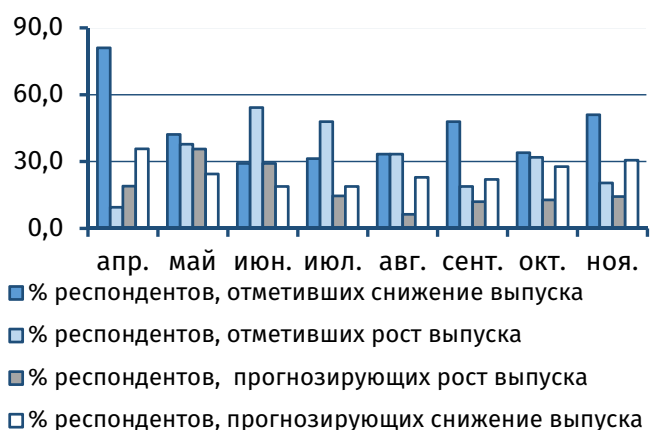
Рис. 3. Оценка текущего и прогнозного объёма выпуска, % от общего числа респондентов