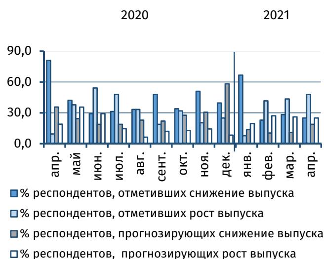
Рис. 3. Оценка текущего и прогнозного объёма выпуска, % от общего числа респондентов