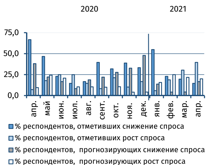
Рис. 2. Оценка текущего и прогнозного уровня спроса, % от общего числа респондентов

В 20,5% организаций увеличилась себестоимость оказываемых услуг, однако подавляющее большинство руководителей (93,2%) сохранили конечные цены для потребителей на уровне предыдущего месяца. На фоне активизации деятельности на 11,4%