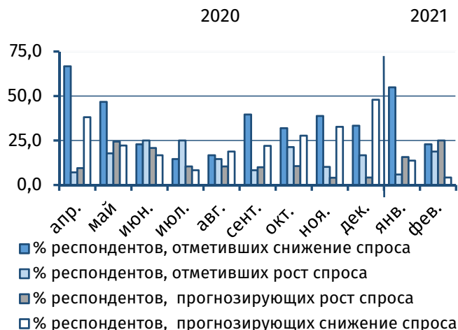
Рис. 2. Оценка текущего и прогнозного уровня спроса, % от общего числа респондентов

Композитный индекс , рассчитываемый на основании взвешенных оценок респондентов относительно объёма выпуска в производственном секторе и в сфере услуг, также продемонстрировал двукратный рост с 28,2% до 61,9% 7 , выйдя в положительную зону.