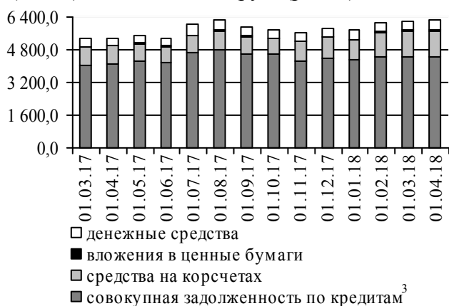
Рис. 3. Динамика основных видов активов, млн руб.

Срочная депозитная база в целом сократилась на 95,8 млн руб. (-2,5%), до 3 670,4 млн руб. Остаток средств на текущих счетах клиентов снизился на 19,4 млн руб. (-0,9%), до 2 104,1 млн руб. (рис. 2).