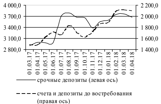
Рис. 2. Динамика депозитной базы, млн руб.

Срочная депозитная база в целом сократилась на 95,8 млн руб. (-2,5%), до 3 670,4 млн руб. Остаток средств на текущих счетах клиентов снизился на 19,4 млн руб. (-0,9%), до 2 104,1 млн руб. (рис. 2).