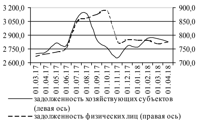
Рис. 4. Динамика задолженности по кредитам, млн руб.

Остаток совокупной задолженности по кредитам и приравненным к ним средствам сократился на 9,1 млн руб. (-0,2%), сложившись на 1 апреля на отметке 4 429,4 млн руб. Ключевым моментом в данной динамике выступило уменьшение задолженности