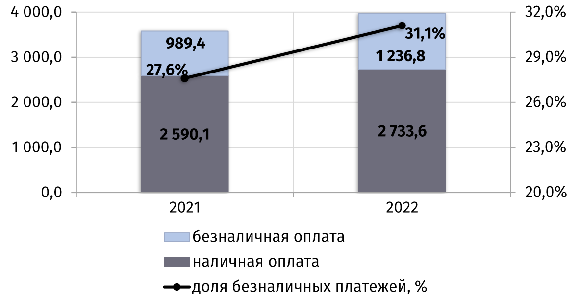
динамика потребительского рынка в январе-апреле 2 (в текущих ценах, млн руб.)

2 733,6 млн руб. -3,4% г/г в январе-апреле 2022 года