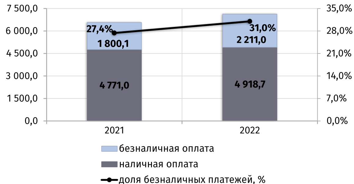
динамика потребительского рынка в январе-июле 2 (в текущих ценах, млн руб.)