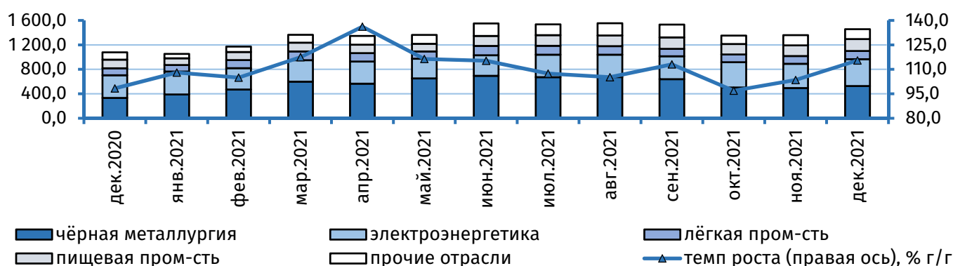
Рис. 1. Динамика промышленного производства в 2020-2021 гг., млн руб.

Декабрьские данные опроса крупных промышленных предприятий также свидетельствовали о повышении производственных параметров. Так, подиндекс выпуска организаций возрос до 57,8% (против 47,9% в ноябре). Индекс деловой активности в целом сложился выше стабилизационной отметки, составив 51,2% (-0,7 п.п. к ноябрьскому значению). Однако индекс промышленного оптимизма, напротив, снизился на 14,7 п.п., до 4,5%, что стало результатом ухудшения оценок относительно объёма выпуска в предстоящем месяце, ввиду календарного фактора (количество рабочих дней в январе является наименьшим во всём году).