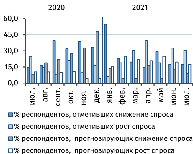
Рис. 2. Оценка текущего и прогнозного уровня спроса, % от общего числа респондентов

Деловые ожидания экономических агентов республики в отношении дальнейшей динамики выпуска и спроса носили преимущественно сдержанный характер. Так, большинство респондентов не ждут изменений в части данных параметров (56,5% (+17,4 п.п.) и 63,0% (+10,8 п.п.) соответственно). Доля руководителей, прогнозирующих рост объёмов производства, сократилась на 6,6 п.п., до 21,7%, повышение спроса – на 2,2 п.п., до 17,4% (рис. 2, 3). Удельный вес участников, ожидающих снижения данных показателей, составил 13,0% (-4,4 п.п.) и 8,7% (-4,3 п.п.) соответственно.