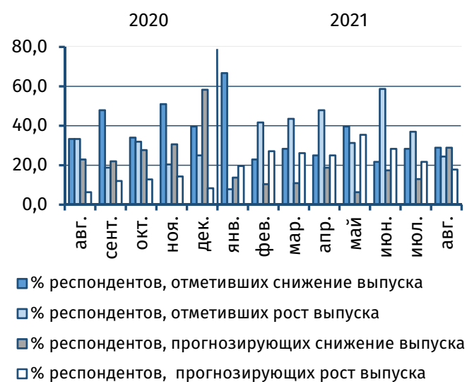
Рис. 3. Оценка текущего и прогнозного объёма выпуска, % от общего числа респондентов